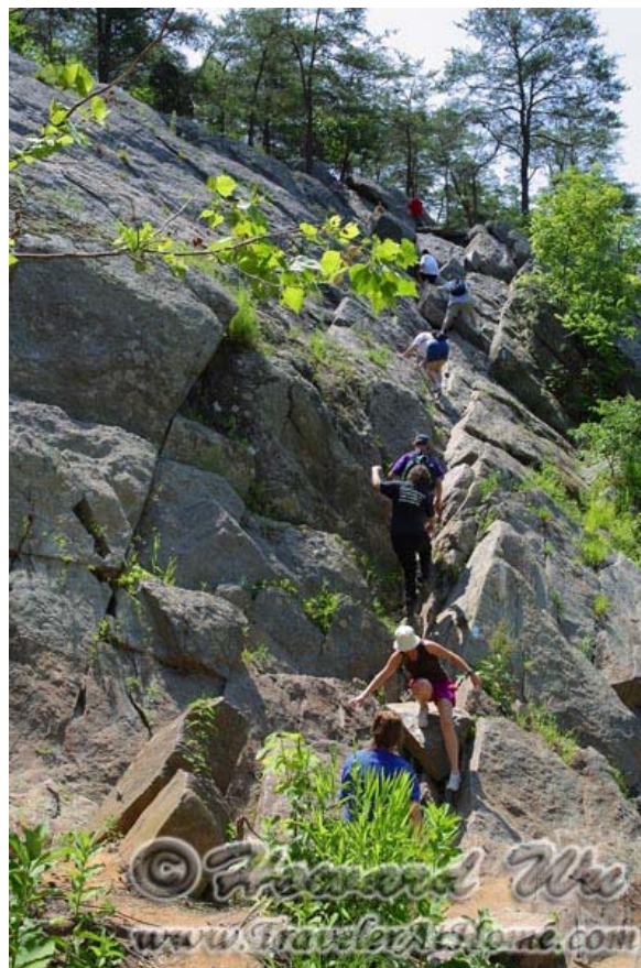
马里兰一侧的Billy Goat Trail

如果对野生动物感兴趣的话，可以再去南面弗吉尼亚的 Mason Neck National Wildlife Refuge 和 Mason Neck State Park 。这里是沿着波多马克河的沼泽，常常有各种鸟兽出没，我在这里常常看到美国国鸟白头鹰(Bald Eagle)、冬天看到过Tundra Swan，其它常见鸟类就更多了。但是如果你对纯粹的野生动物观赏并不很感兴趣，或许这里并不适合你，因为只是低洼沼泽地带。不过，也不能说这里的景色一无是处，州立公园处的Belmont Bay是一个宽阔的水湾(不