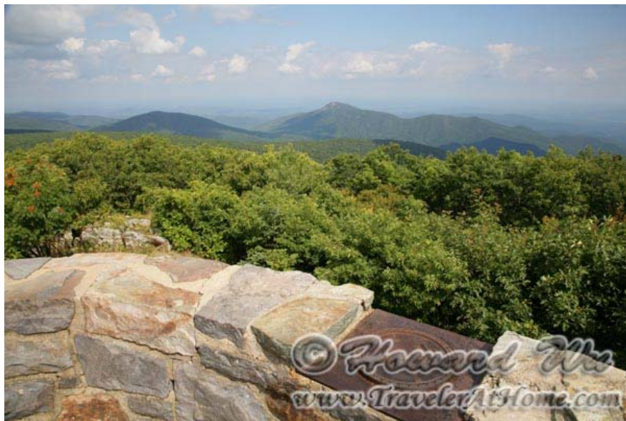
Hawk's Bill Summit, 园中最高峰

要登高峰，路径最短的是从Skyland开始的Stony Man Trail, 从这里不到一个钟头之内就可以到达园内第二高峰，4011尺的Stony Man Peak, 沿途还可以改道去Little Stony Man Peak, 景色都很不错。当然也可以去登园内最高峰，4051尺的 Hawk's Bill 峰，其实山道也不很长。