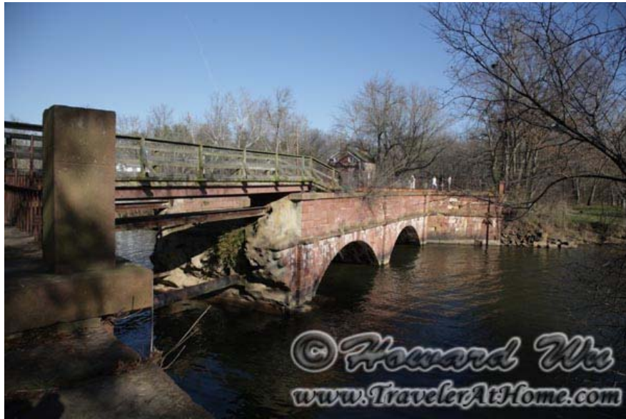
Seneca Creek Aqueduct