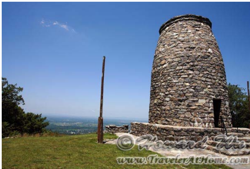
你可能没听说过的一个华盛顿纪念碑

再远一点可去的地方就更多了。在马里兰有一个 Washington Monument State Park , 这里也有个华盛顿纪念碑, 但跟DC那个不同的是, 这是一个石头砌成的碉堡一样的纪念碑, 而且是历史上第一个纪念华盛顿的纪念碑。附近还有一个 Greenbrier State Park , 著名的Appalachian Trail从这两个公园通过, 如果喜欢hiking, 这里有很多山道可供选择。这两个公园都在270号公路旁边。附近还有一个更大一点的公园, Catoctin Mountain Park , 是国家公园总署管理的, 有更多登山步行的机会。