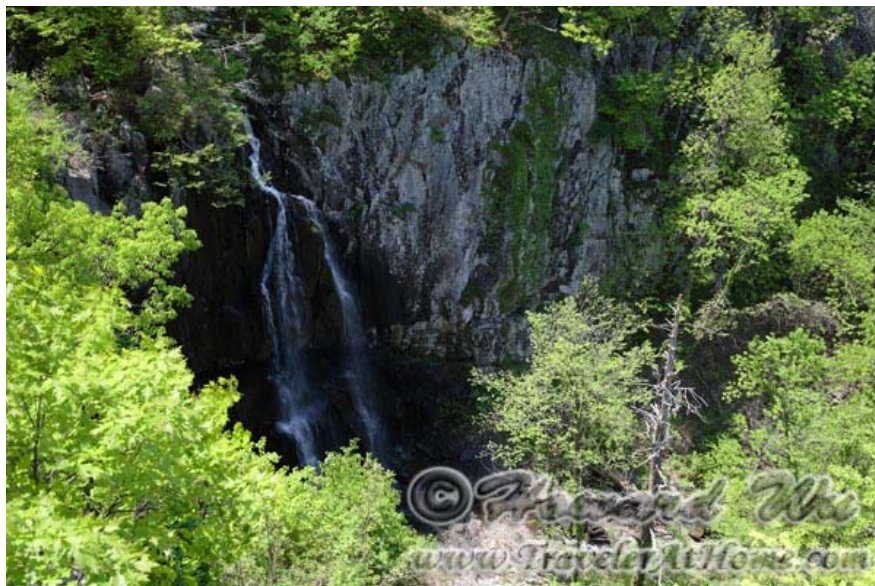
Overall Run Falls

要看瀑布，路径最短的是Dark Hallow Falls，起点在Big Meadows附近；但Mathew's Arm Campground附近的Tuscarora Trail上的Overall Run Falls是园中最高的，但这个trail比较长一点(差不多十英里)。