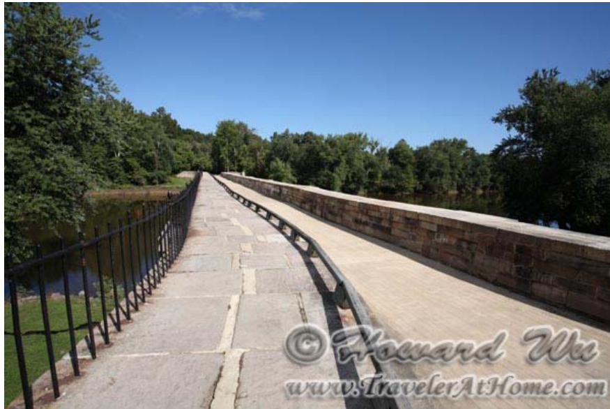
Monocacy Aqueduct上面的景象, 你可以看到让运河通过的水渠(现在没有灌水)

再远一点可去的地方就更多了。在马里兰有一个 Washington Monument State Park , 这里也有个华盛顿纪念碑, 但跟DC那个不同的是, 这是一个石头砌成的碉堡一样的纪念碑, 而且是历史上第一个纪念华盛顿的纪念碑。附近还有一个 Greenbrier State Park , 著名的Appalachian Trail从这两个公园通过, 如果喜欢hiking, 这里有很多山道可供选择。这两个公园都在270号公路旁边。附近还有一个更大一点的公园, Catoctin Mountain Park , 是国家公园总署管理的, 有更多登山步行的机会。