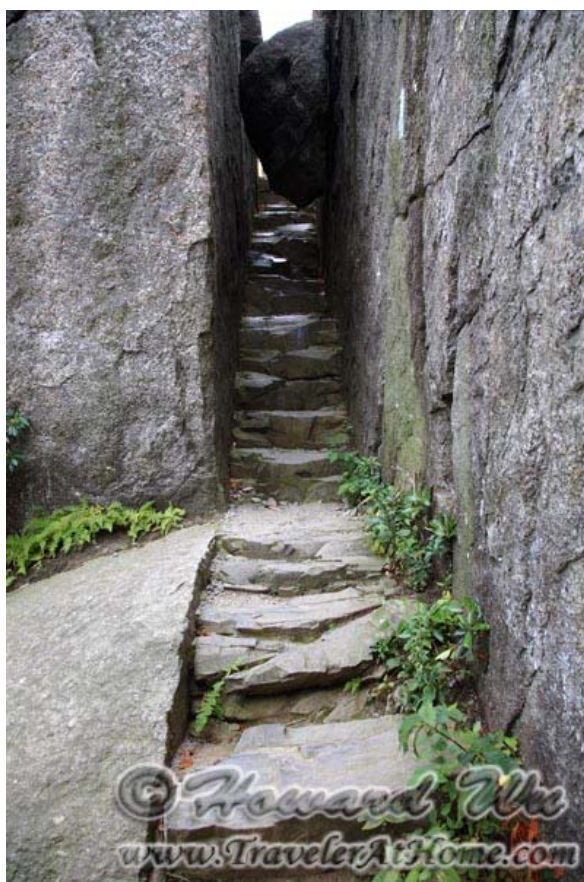
去Old Rag路上经过的天然石梯

要camping的话园里的camp site有好几个，我一般去Mathew's Arm。Big Meadows处设施更为齐全，还可以洗澡。