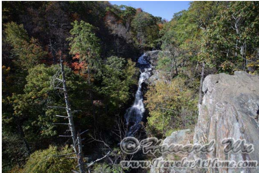
White Oak Canyon

要登高峰，路径最短的是从Skyland开始的Stony Man Trail, 从这里不到一个钟头之内就可以到达园内第二高峰，4011尺的Stony Man Peak, 沿途还可以改道去Little Stony Man Peak, 景色都很不错。当然也可以去登园内最高峰，4051尺的 Hawk's Bill 峰，其实山道也不很长。