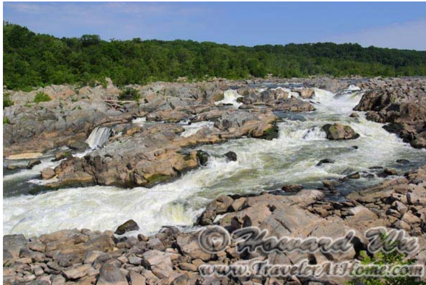
从马里兰一侧看到的Great Falls