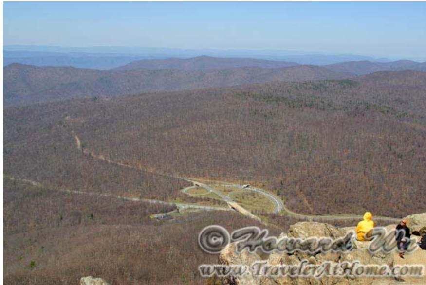
Mary's Rock初春的景色，树木还没有长出叶子

公园里还有许多山峰，我就不一一列举了。如果时间不够但又想体会一下，可以去Dark Hallow Falls和Stony Man Peak，这样既看了瀑布又登了高峰，大半天可以搞定。