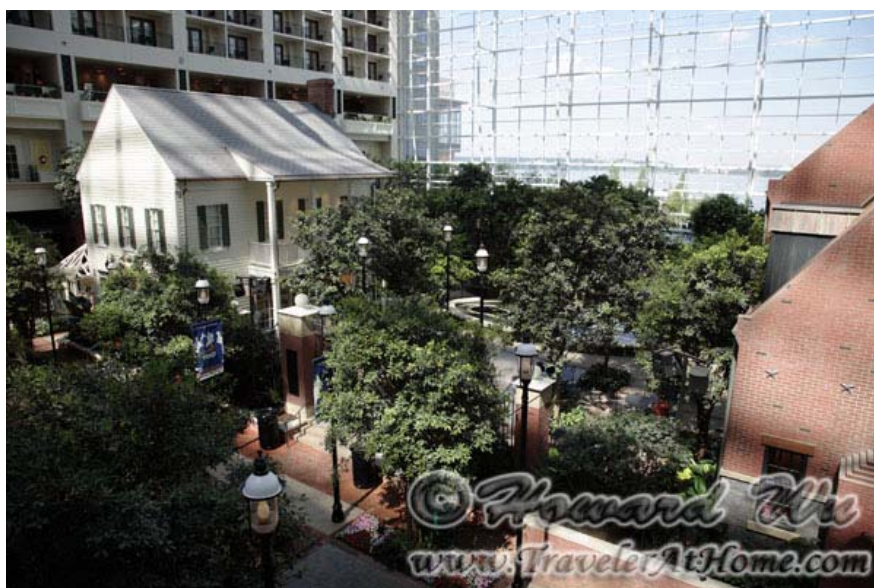
Gaylord Hotel and Convention Center内的景象

然后是我上个部分提到的C&O Canal。因为这条运河从乔治敦到西弗吉尼亚和马里兰交界处的Cumberland Gap全长180余英里，确实是从华盛顿城里一直延伸到很远的地方，所以我在三个部分都会提到它。我前面提到的Great Falls在马里兰一侧，就有运河从旁边经过，我在这里再提两个景点：这两个都是引水渠(Aqueduct)。说到引水渠，你可能会想到古罗马帝国的引水渠，但那是用来运送饮用水(和生活用水)的渠道。C&O上的引水渠，却是用来行船的！这是因为，运河的走向是沿着波多马克河的，如果遇上汇入河中的支流，运河必须从它们之上跨过。所以，这些“引水渠”，实际上是一座座桥梁，只是它们装载的，也是盛满水的运河。所以以桥载河，而又跨过另一条小河，也可以算得上小小的奇观。在华盛顿周边范围之内，有两个引水渠不可错过，一个是22英里处(里程是从乔治敦算起的)的Seneca Creek Aqueduct，另一个是42英里处的Monacacy Aqueduct。其中后者是七拱桥(或说七拱渠)，是整个运河之上跨