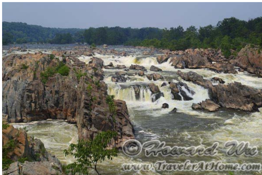
从弗吉尼亚一侧看到的Great Falls

稍微出城一点，可以去看Great Falls of the Potomac。在这里有两个国家公园总署管理的公园，弗吉尼亚一侧是 Great Falls National Park ，马里兰一侧是 Chesapeake & Ohio Canal National Historical Park 的Great Falls Tavern。两边景色都不错，都有步行道。景色嘛，二者类似，但有稍有不同，很难说那个更美。但我个人觉得马里兰一侧可能更好，因为这里有Chesapeake & Ohio Canal通过，还有一个Billy Goat Trail，是沿着河岸在乱石丛中的一条步道，有时必须手脚并用才能爬过。