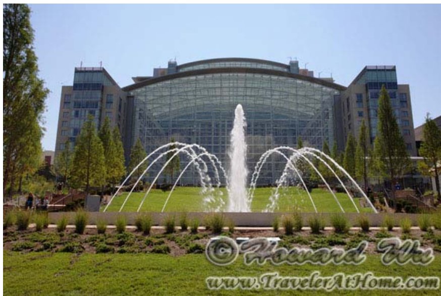
Gaylord Hotel and Convention Center

一座是乔治敦row house，另一座是弗吉尼亚庄园式建筑。而且通过几十米高的巨型玻璃窗可以看到外面的大河，可谓别有风味。