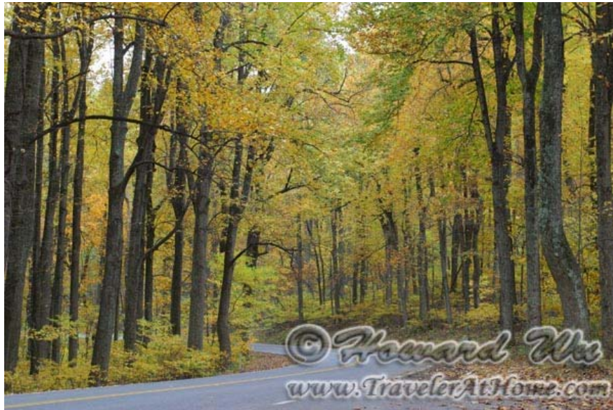
Shenandoah国家公园里Skyline Drive上的景象

话休絮烦。很多人去香浓多，就是在空中公路(Skyline Drive)上走走停停开一圈，殊不知，Shenandoah里的很多景色必须步行才能看到。我在香浓多内近十年来总共hiking过三十余次，可以大言不惭地说对这个公园已经是了如指掌了吧！可以列举的地方太多，我就稍稍提到几个吧：