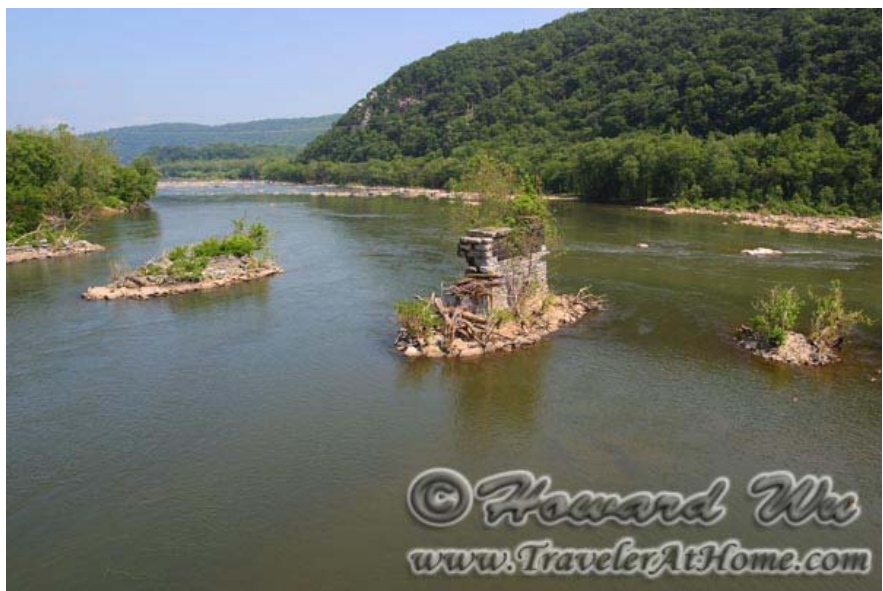
Harper's Ferry, 香浓多河和波多马克河的交汇处